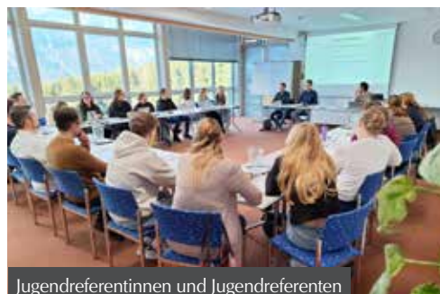
Jugendreferentinnen und Jugendreferenten