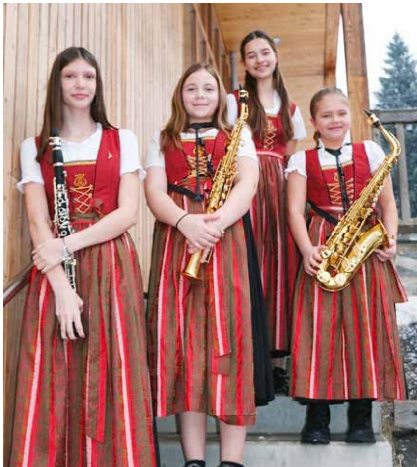
Clarisax erspielte sich in der Stufe A den Sieg.

Der Musikbezirk Spittal an der Drau bedankt sich bei allen, die mitwirkten, für den spannenden Wettbewerbstag und freut sich auf ein baldiges Wiedersehen im Zuge der Blasmusik!