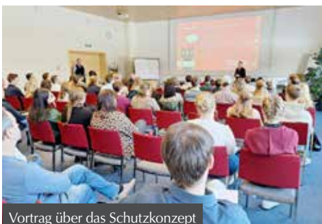
Vortrag über das Schutzkonzept