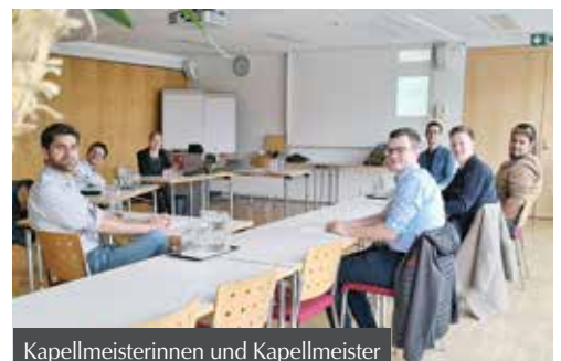
Kapellmeisterinnen und Kapellmeister