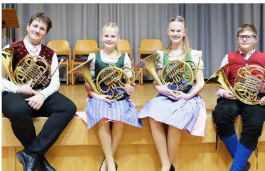
Perfekte 100 Punkte in der Stufe B: Quartetto Suono del corno