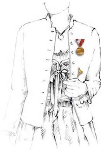
Abbildung 3: Brust- und Steckdekorationen