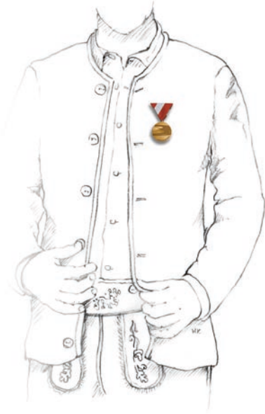
Abbildung 1: Brustdekoration