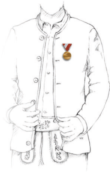
Abbildung 1: Brustdekoration