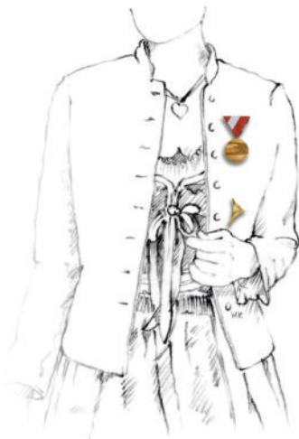
Abbildung 3: Brust- und Steckdekorationen