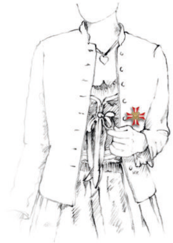
Abbildung 2: Steckdekoration