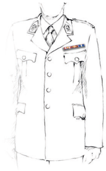
Abbildung 4: Ordensspange